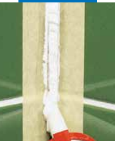
Aanbrengen van Mapesil AC

Deze kit heeft de vorm van een thixotrope pasta en kan eenvoudig op horizontale en verticale oppervlakken worden aangebracht. De netvorming treedt op na blootstelling aan de luchtvochtigheid van de omgevingstemperatuur waardoor een elastisch product ontstaat met de volgende eigenschappen: