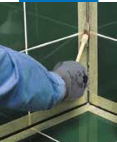
Aanbrengen van Primer FD