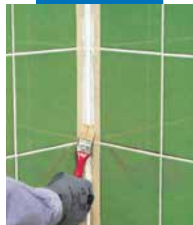
Gladmaken van de voeg met zeepwater en een kleine kwast