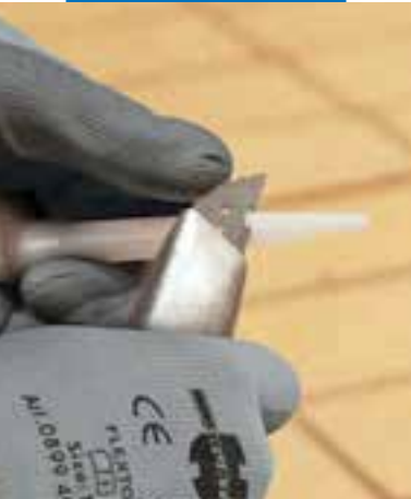
Afsnijden van de spuitmond overeenkomstig de voegafmetingen