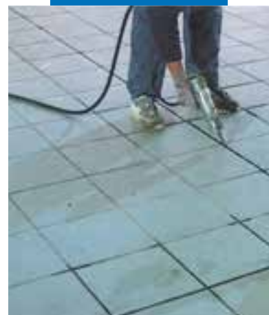
Afdichten van een keramische tegelvloer met Mapesil AC