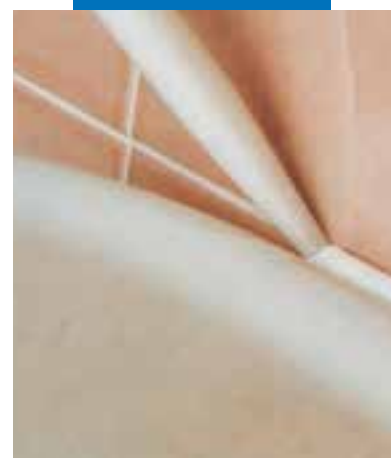
Afkitten van sanitair